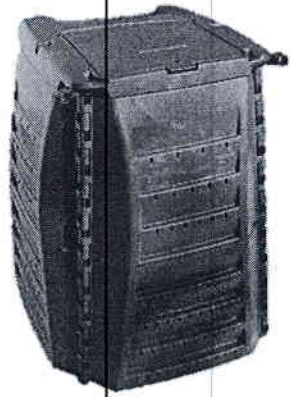
Modèle plastique 400 litres